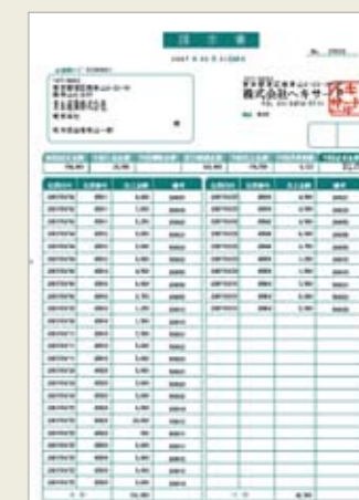
▲スーパー指定請求書